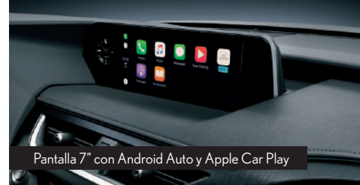
Pantalla 7" con Android Auto y Apple Car Play